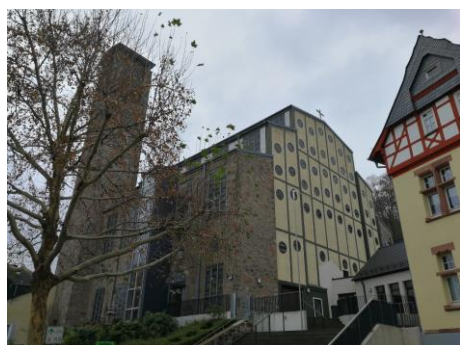
Herz Jesu Dillenburg