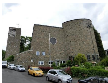
St. Petrus Herborn